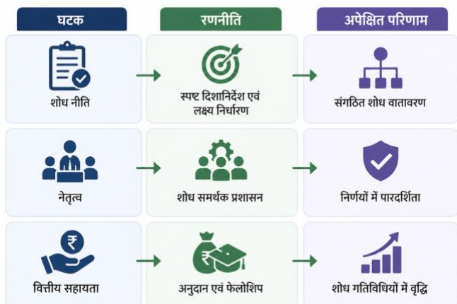
तालिका 3: विद्यार्थी सहभागिता रणनीतियाँ